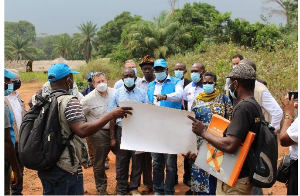
Visite d'une mission conjointe à Modale, province du Nord Ubangi où des réfugiés centrafricains vont bientôt être relocalisés