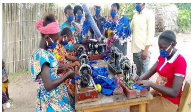
Un groupe de femmes réfugiées produit des masques pour la communauté de Boyabu, province du Sud Ubangi