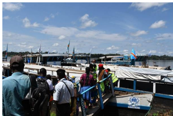
Des réfugiés du camp de Boyabu, dans la province du Sud-Ubangi, rentrent à Bangui en bateau grâce au soutien du HCR et de la CNR