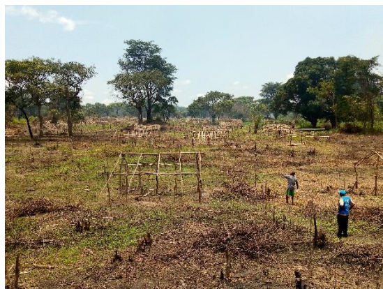
Des réfugiés centrafricains construisent des abris avec l'aide du HCR sur le terrain qui leur a été accordé par les autorités locales dans le Nord Ubangi.