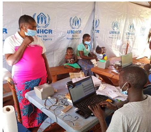
Des réfugiés centrafricains participent à un exercice de vérification physique dans le camp de Boyabu, province du Sud-Ubangi