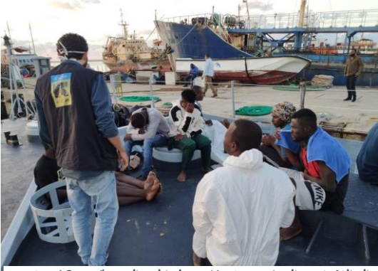
إنزال اللاجئين والمهاجرين في قاعدة طرابلس البحرية يوم 10 نوفمبر.

حتى 12 نوفمبر، سُجّل إنقاذ/اعتراض 9,506 لاجئاً ومهاجراً في البحر من قبل حرس السواحل الليبي، وأنزلوا في ليبيا. في 12/11 نوفمبر، تم الإبلاغ عن تحطم قاربين قبالة السواحل الليبية. غرق أحد القاربين قرب الخمس وكان على متنه 120 شخصاً، تم إنقاذ 47 منهم. وكان الثاني قرب صرمان، حيث ورد أن الحادث تسبب في مقتل 20 شخصاً. في 10 نوفمبر، تدخل حرس السواحل الليبي وأعاد قارباً خشبياً وعلى متنه 11 شخصاً إلى قاعدة طرابلس البحرية. ولقد انتشلت جثة واحدة ومازال 13 شخصاً في عداد المفقودين. كانت مفوضية اللاجئين وشريكها لجنة الإنقاذ الدولية حاضرتين في نقاط الإنزال لتقديم المساعدة الطبية العاجلة و مواد الإغاثة الأساسية.