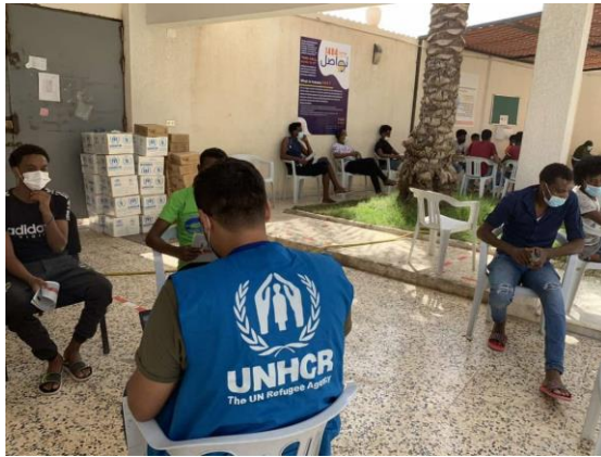
موظفو مفوضية اللاجئين وهم يقومون بإجراءات نحو 20 شخصاً أطلق سراحهم مؤخراً. المركز المجتمعي، طرابلس.

خلال فترة التقرير، استقبلت المفوضية 336 شخصاً لمواعيد تحديد وضع اللاجئين ومواعيد إعادة التوطين، وذلك في مكتب التسجيل بالسراج. كما سجلت مفوضية اللاجئين 190 لاجئاً وطالب لجوء (من بينهم 44 أنثى) معظمهم من السودان، وآخرين من سوريا وإريتريا والصومال وإثيوبيا وجنوب السودان وبوركينا فاسو. حتى 7 سبتمبر، سجلت المفوضية 5,821 فرداً هذا العام.