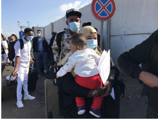
نرابلس، وصول الأشخاص الذين تم إجلاؤهم إلى المطار للتوجه صوب مركز العبور الطارئ في رواندا.