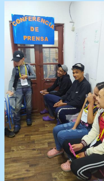
GF NNA en La Paz

"No puedo ir al colegio porque no tengo la cedula boliviana"