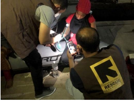
عملية الإنزال في قاعدة طرابلس البحرية، 29 يونيو .

1 المنظمة الدولية للهجرة - مصفوفة تتبع النزوح: فبراير 2021 2 البيانات حتى تاريخ 1 يوليو 2021