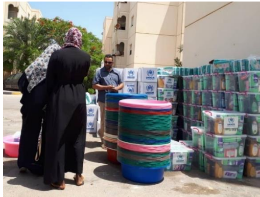
توزيع مواد الإغاثة الأساسية على النازحين في طرابلس.

تواصل مفوضية اللاجئين مساعدة النازحين داخلياً في ليبيا. في 6 يوليو، وزعت المفوضية - من خلال شريكها الوطني الهيئة الليبية للإغاثة - مواد الإغاثة الأساسية على 660 نازحاً في منطقتي السبعة والدعوة الإسلامية في طرابلس. وشملت المساعدة المراتب ومستلزمات النظافة والحفاظات والبطانيات والمصابيح الشمسية. حتى الآن في 2021، قدمت المفوضية مواد الإغاثة الأساسية إلى 18,695 نازحاً وعائداً من النزوح في أنحاء ليبيا. بالإضافة إلى ذلك، استهدفت المفوضية - من خلال شريكها المجلس النرويجي للاجئين - 373 فرداً بالمساعدة القانونية والمشورة بشأن القضايا المتعلقة بالإسكان وحقوق الأراضي والعقارات والتوثيق المدني.