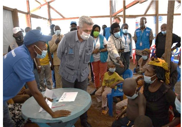
Le Haut Commissaire pour les réfugiés Filippo Grandi parle avec des réfugiés centrafricains qui viennent d'être relocalisés au site de Modale, province du Nord-Ubangi.