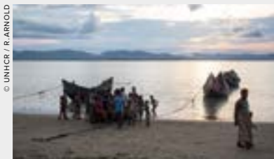
De nombreux réfugiés fuyant le Myanmar vivent des atrocités inimaginables.

En juillet 2017, une délégation de 160 réfugiés afghans s'est rendue du Pakistan en Afghanistan pour demander à ce que des mesures soient prises en vue de pérenniser les retours, notamment en