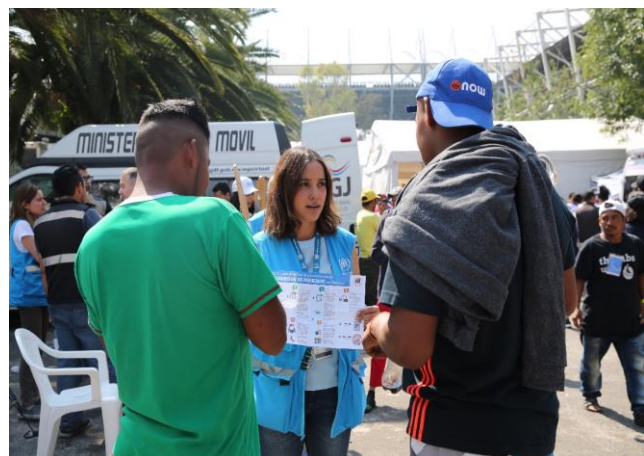
Personal del ACNUR brinda información sobre el sistema de asilo en México a personas con necesidad de protección internacional. Ciudad de México, 8 de noviembre de 2018.

El ACNUR y sus socios duplicaron su capacidad a 448 espacios para albergar a solicitantes de asilo . Actualmente se está desarrollando un plan de contingencia para aumentar aún más la capacidad a alrededor de 1,500 espacios en ubicaciones estratégicas en todo México.