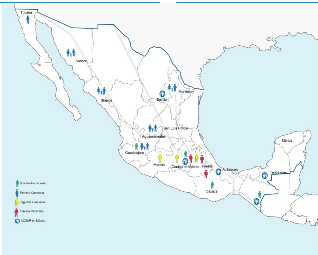
Ubicaciones de grupos de migrantes y rsolicitantes de asilo de las caravanas y oficinas del ACNUR.