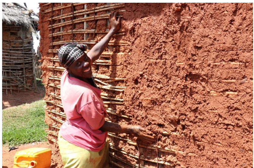
Une déplacée qui construit sa maison à Lubero (Province du Nord-Kivu).