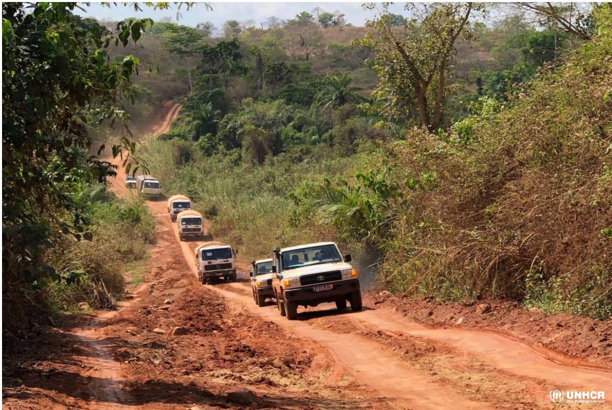
Convoi de Retour Volontaire Sipilou, 01 Mars 2018