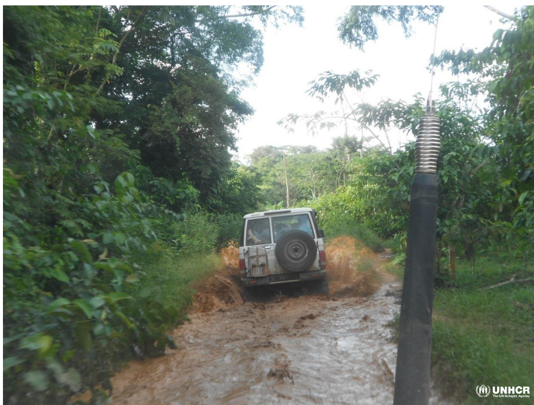
Route en mauvaise état suite aux fortes pluies dans la zones de retour de Zehipleu